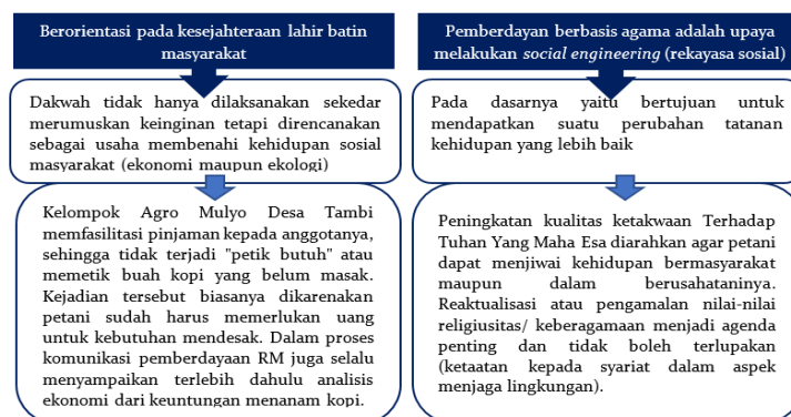
Gambar 2. Prinsip Dasar Pemberdayaan Masyarakat Berbasis Agama

Reposisi komunikasi agama dalam pemberdayaan masyarakat dapat direalisasikan dengan mencermati kembali peran dakwah dalam wujud komunikasi. Pemberdayaan berbasis komunikasi agama ini berperan dalam mempertahankan dan bahkan meningkatkan keimanan masyarakat untuk pelestarian lingkungan. Berdasarkan konsep dasar pemberdayaan masyarakat sebagai bagian dari upaya membangun paradigma model pemberdayaan yang ditemukan di Desa Tambi, Kabupaten Wonosobo, dapat disimpulkan dalam suatu prinsip seperti pada Gambar 2.