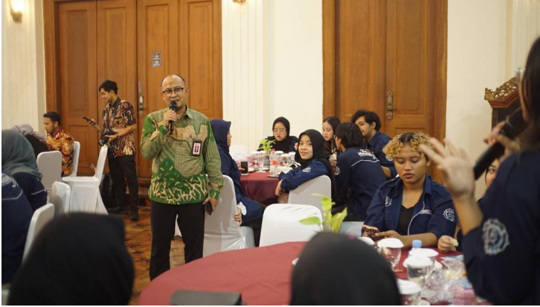
Gambar 4. Materi dari Perwakilan OJK Solo

Setelah membahas karakteristik fintech , Bapak Heri melanjutkan pemaparannya dengan menjelaskan beberapa permasalahan yang sering meresahkan masyarakat. Terdapat tiga isu utama yang menjadi perhatian. Pertama, fintech legal tidak diizinkan mengirimkan penawaran melalui kanal pribadi, sehingga masyarakat perlu berhati-hati terhadap pesan penawaran pinjaman daring yang dikirim dari nomor ponsel pribadi. Kedua, masyarakat harus mewaspadaai praktik pengiriman dana pinjaman tanpa pengajuan resmi. Sesuai dengan regulasi OJK, dana pinjaman hanya dapat diberikan kepada individu yang telah mengajukan permohonan secara resmi. Oleh karena itu, jika seseorang menerima dana tanpa pengajuan, hal tersebut patut dicurigai. Ketiga, maraknya fintech ilegal yang meniru nama fintech berizin untuk menipu masyarakat. Guna menghindari hal ini, masyarakat disarankan melakukan pengecekan berkala terhadap daftar fintech resmi yang diterbitkan oleh OJK.