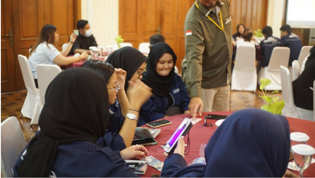
Gambar 3. Materi Pengenalan Keaslian Uang

Selain membahas manfaat QRIS, narasumber juga memberikan pemaparan mengenai langkah-langkah menjaga keamanan dalam bertransaksi menggunakan QRIS. Beberapa langkah yang disarankan antara lain memastikan bahwa nama yang tertera di aplikasi QRIS sesuai dengan nama tempat bertransaksi, mengingat semakin maraknya kasus penyalahgunaan QRIS untuk kepentingan lain. Bagi pelaku usaha dan UMKM, disarankan untuk melakukan pengecekan transaksi secara berkala guna memastikan keaslian QRIS yang digunakan. Jika terjadi kendala dalam transaksi, pengguna dianjurkan untuk segera melaporkannya kepada penyedia jasa pembayaran agar sistem QRIS dapat diperiksa dan ditindaklanjuti dengan cepat. Sesi ini kemudian ditutup dengan tambahan materi mengenai cara mengenali keaslian uang kertas sebagai alat pembayaran resmi, yang menjadi bagian penting dalam literasi keamanan finansial.