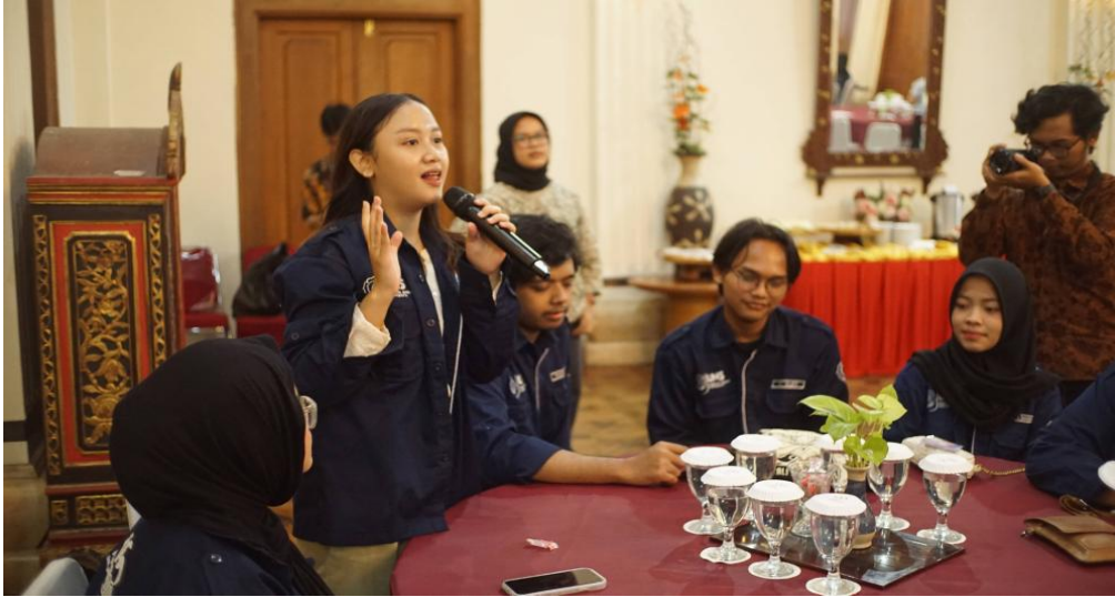
Gambar 5. Sesi Tanya Jawab dengan Peserta

Sesi pemaparan materi dari kedua narasumber diakhiri dengan sesi tanya jawab yang interaktif. Beberapa peserta mengajukan pertanyaan terkait kebocoran data dan langkah-langkah mitigasi yang dilakukan OJK, pemalsuan data oleh peminjam dalam sistem fintech , serta perkembangan dan rencana ke depan terkait implementasi QRIS. Kedua narasumber memberikan jawaban yang komprehensif untuk menjelaskan setiap isu yang diajukan. Acara literasi finansial ini kemudian ditutup dengan pemberian kenang-kenangan berupa sertifikat kepada masing-masing narasumber sebagai bentuk apresiasi atas kontribusi mereka dalam memberikan edukasi kepada peserta.