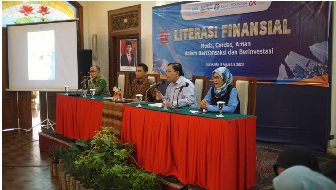
Gambar 1. Sambutan dari Ketua Grup Riset

Narasumber pertama adalah Aries Purnomohadi, Deputy Kepala Perwakilan Bank Indonesia Solo, yang membawakan materi tentang keamanan dalam bertransaksi digital. Selain itu, beliau bersama tim dari Bank Indonesia turut memberikan edukasi tambahan mengenai cara mengenali keaslian uang kertas, yang menjadi bagian penting dari literasi keamanan finansial. Sementara narasumber kedua adalah Heri Santosa, Kepala Bagian IKNB, Pasar Modal, dan EPK dari Otoritas Jasa Keuangan (OJK) yang membahas keamanan dalam berinvestasi, khususnya yang berkaitan dengan fintech dan fintech lending .