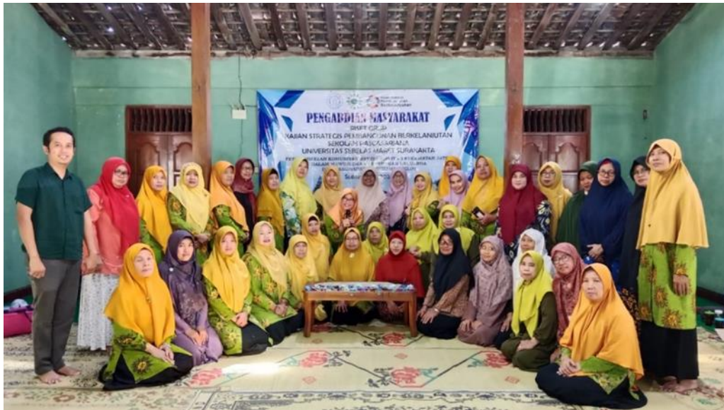
Gambar 2. Suasana Kegiatan Pemberdayaan Komunitas Aisyiyah Jaten

memberikan Pelatihan Pengelolaan Limbah Rumah Tangga berbasis Ekonomi di Aisyiyah Jaten, karena wanitalah yang akan menjaga ketahanan keluarga dari kemungkinan-kemungkinan dampak dari perubahan iklim yang tidak menentu. Kegiatan terbagi menjadi dua sesi, sesi satu adalah pelatihan pembuatan aksesoris bros berbahan limbah rumah tangga, Sesi dua adalah pelatihan pembuatan kompos dan pupuk organik cair. Pembuatan bros dipandu oleh Noer Hidayati, pelaku UMKM aksesoris dari Laweyan Surakarta, dan pembuatan kompos serta pupuk cair oleh Sulistyio, M.Si. mahasiswa program S3 Ilmu Lingkungan UNS.