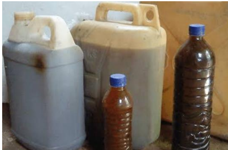
Gambar 3. Pupuk Organik Cair

Pupuk organik cair adalah pupuk yang terbuat dari bahan organik alami seperti kompos, kotoran hewan, dan sisa tanaman. Proses fermentasi ini menghasilkan cairan kaya nutrisi yang dapat meningkatkan kesuburan tanah. Pupuk organik cair mendukung pertumbuhan tanaman secara alami dan berkontribusi pada keberlanjutan lingkungan dengan mengurangi ketergantungan pada pupuk kimia. Penerapannya yang mudah dan ramah lingkungan membuatnya populer di kalangan petani organik dan penggemar pertanian berkelanjutan.